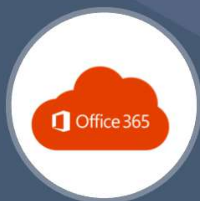
Microsoft Office Online